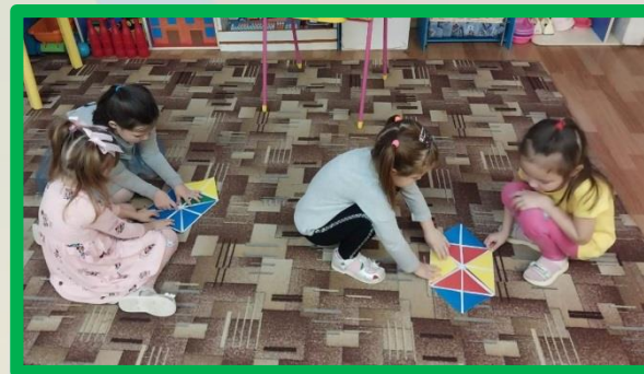
Технология «Квадрат Воскобовича»