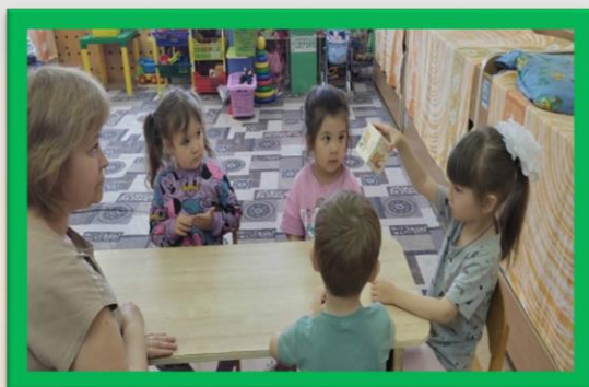
Технология «Кубик Блума»